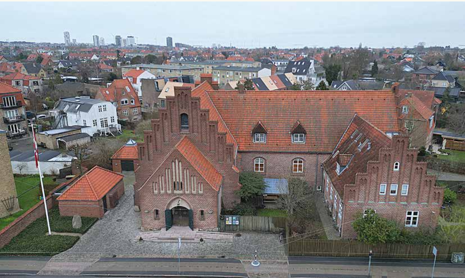
Den 1. april 1935 blev Filips sogn delt, og Simon Peters sogn opstod. Først blev menighedshuset og præsteboligen bygget og i 1944 blev kirken færdiggjort.

"Eftermiddagsmøder, Kirkekoncerter, Liturgisk gudstjeneste, Jule stue, Juletræsfest, fastelavnfest, FDF/FPF, Menighedsplejens juleindsamling, Hjemmeværnets fejring af nytår ved gudstjeneste m.m."