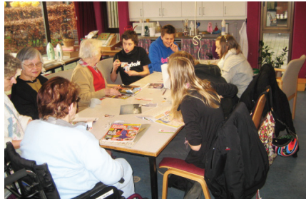
Ældre og konfirmander hygger sig i Bomiparken