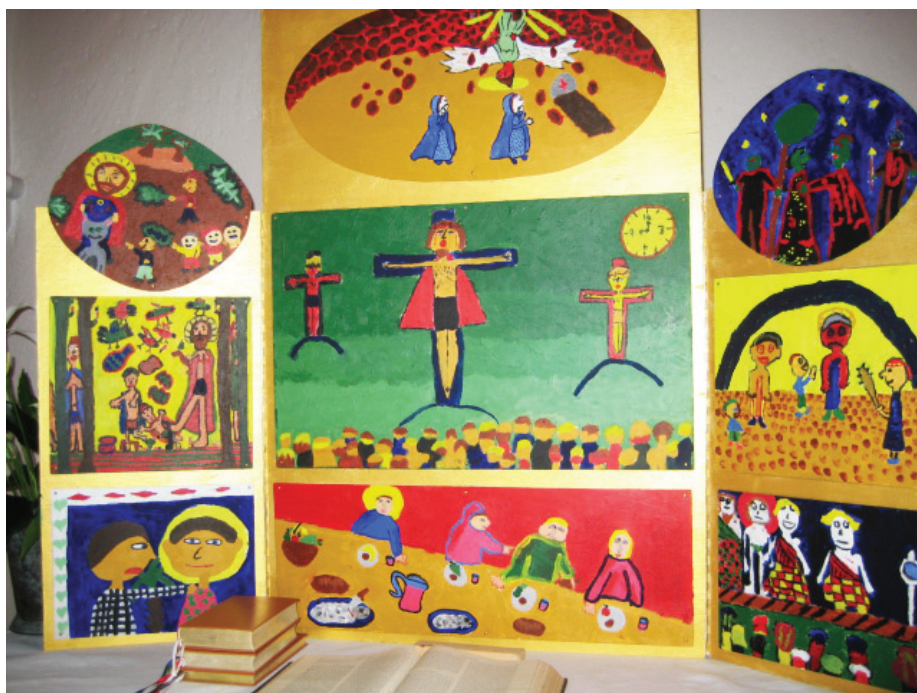
Børnealtertavlen er udført af elever fra Gerbrandtskolens 4. kl.